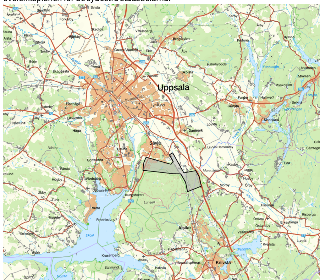
Orienteringskarta, gråtransparant område där kommunen avser att ansöka om planeringsbesked. Området återfinns cirka 7 kilometer söder om Uppsala centralstation.

Ett positivt planeringsbesked skulle bidra till långsiktiga och förutsägbara planeringsförutsättningar för kommande detaljplanläggningar inom den fördjupade översiktsplanen för de sydöstra stadsdelarna.